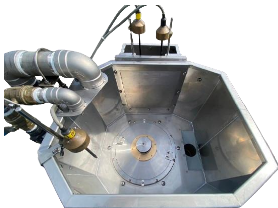
槽の内部(配電盤側から)